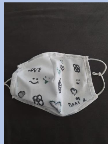
Daria Białous, klasa III