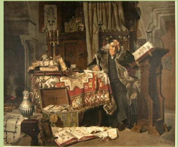
Jan Długosz – kronikarz. Ob. Jan Matejko

ROZBICIE DZIELNICOWE (inaczej rozdrobnienie feudalne) – okres w historii Polski trwający od 1138 roku do koronacji Władysława Łokietka w 1320 roku.