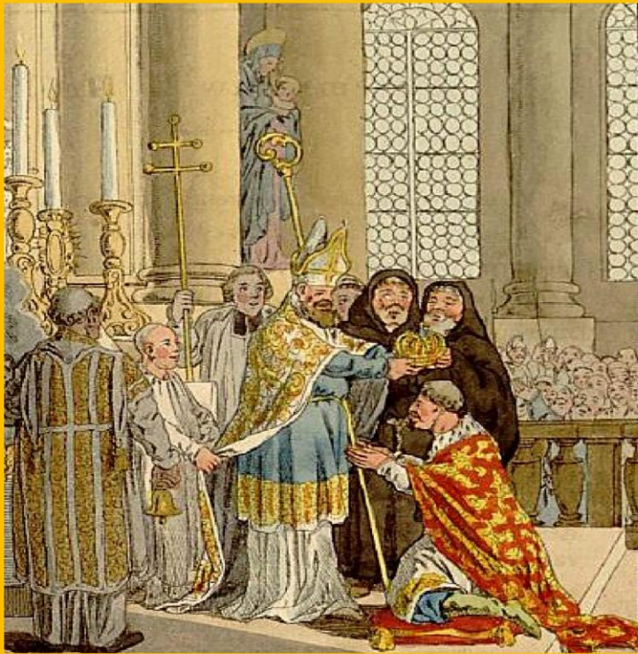
Koronacja Łokietka odbyła się w Krakowie na Wawelu w 1320 roku.