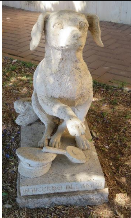
Pomnik psa Lampo na stacji Campiglia Marittima